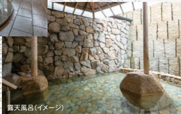
露天風呂(イメージ)