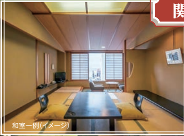
和室一例(イメージ)